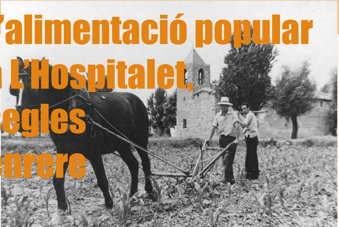
Pagesos de Cal Biolet del Garro al costat de l'ermita de Bellvitge.

La història alimentària de L'Hospitalet revela una societat forjada al voltant de l'economia de subsistència, amb una forta vinculació a la terra i als recursos propis . Al segle XVII, L'Hospitalet era una vila agrícola i ramadera, amb horts domèstics, conreu de cereals, llegums i hortalisses, i una dieta senzilla però adaptada al territori.