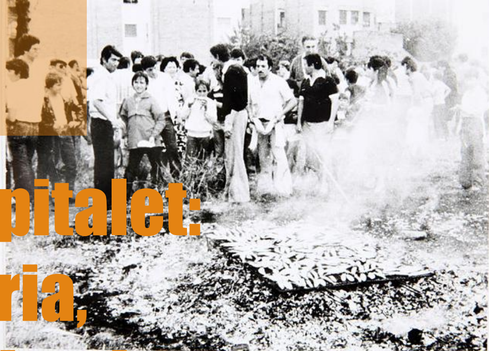
Arxiu Municipal de L'Hospitalet. Sardinada popular per la festa major del barri de Sanfeliu