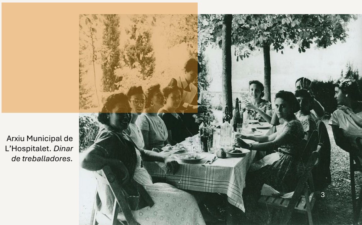
Dinar de treballadores.

És una paraula que remet a la festa, però també a la quotidianitat compartida; a la barreja d'ingredients i sabors, però també a la barreja de veïnatges, històries i orígens que fan de L'Hospitalet una ciutat viva i plural. En aquest sentit, parlar de Xefla és parlar d'Hospitalet: una ciutat on cuinar és estimar, i compartir taula, una forma de fer ciutat.