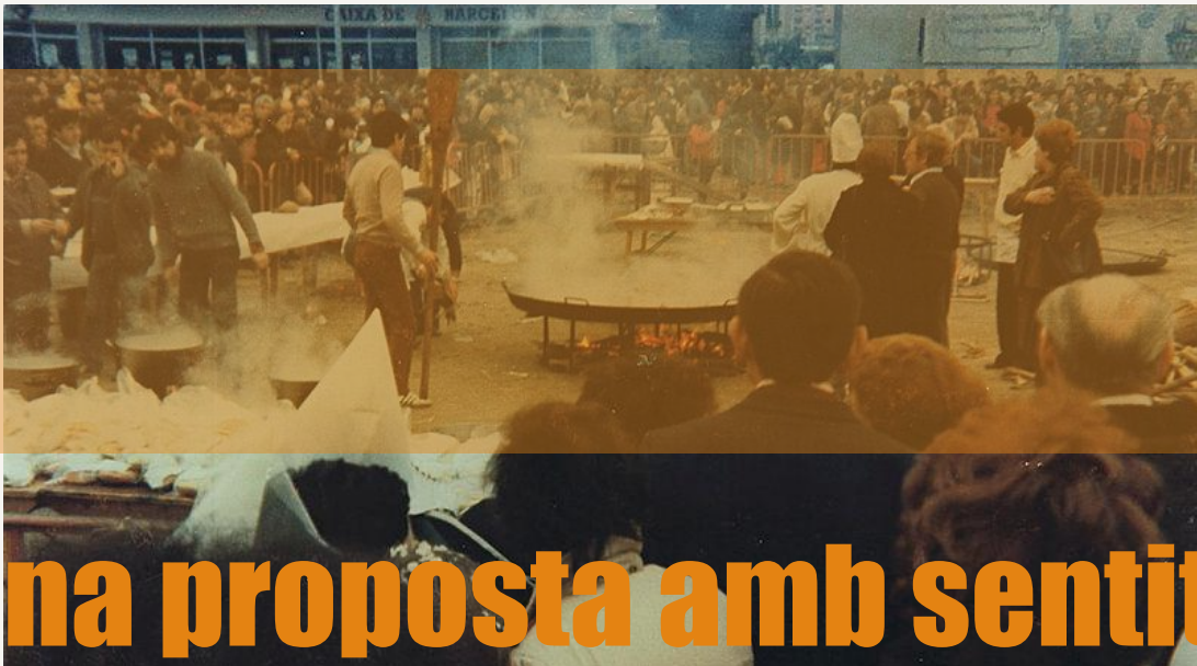
Paella a Bellvitge.